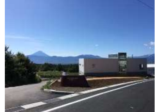
マルス穂坂ワイナリー