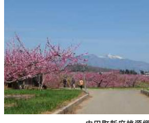
中田町新府桃源郷