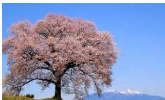
神山町 わに塚のさくら

かみやままち あさひまち おおくさまち たつおかまち 神山町・旭町・大草町・龍岡町