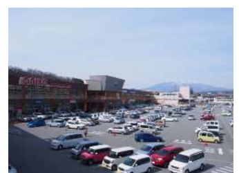
商業施設「ライフガーデン韭崎」