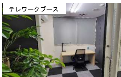
テレワークブース