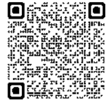
成約者支援補助金

助成要件 補助対象経費の総額が5万円以上であること。 空き家バンク制度で成約した物件に2年以上、継続して居住すること。 売買契約書又は賃貸借契約を締結した日から1年以内の申請であること。