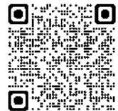
リフォーム補助金 家財処分補助金 解体工事補助金

助成要件 補助対象の工事費用の総額が20万円以上であること。 市内事業者の施工によるリフォームであること。 売買契約書又は賃貸借契約を締結した日から1年以内の申請であること。 施工開始前の申請であること。 住まいるマイホームの助成を受けていないこと。（予定者を含む）