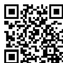
山梨県 移住支援・就業マッチングサイト