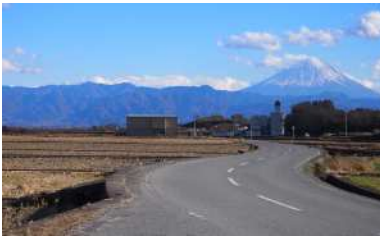
円野町から清哲町への農道風景